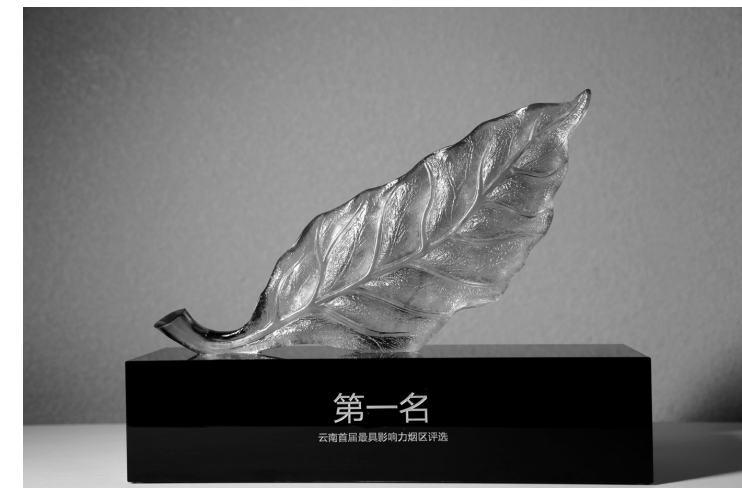
弥勒烟区荣获“云南首届最具影响力烟区”第一名。