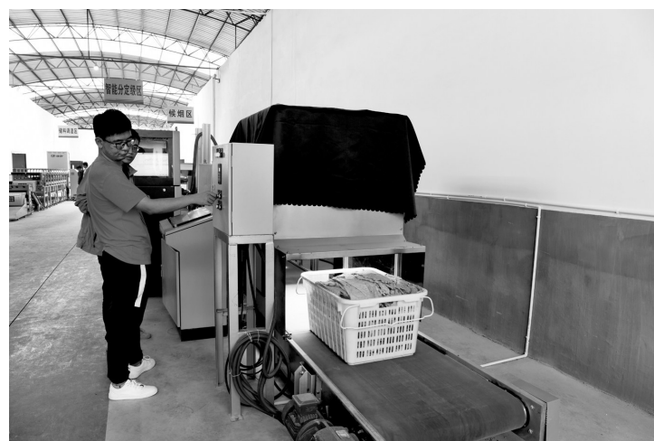
位于弥勒市的云南烟草“双创新”基地内，烟叶智能分定级机正在运行。