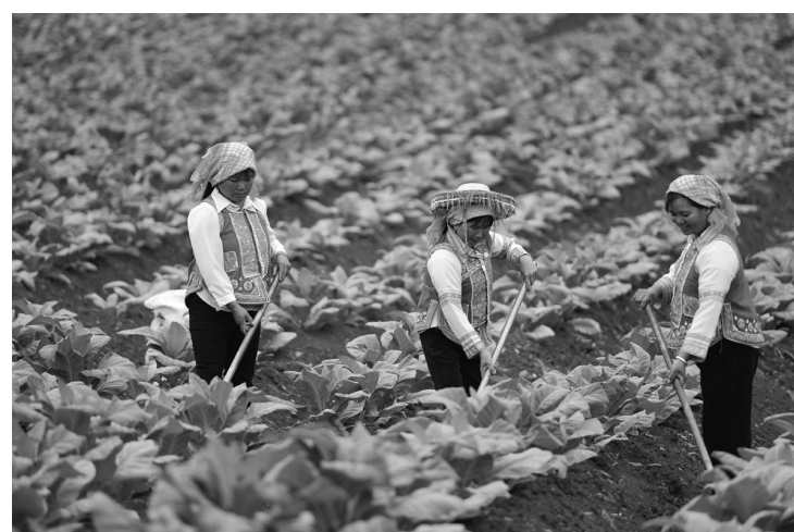
建水县彝族烟农中耕忙。

非弘不能胜其重，非毅无以致其远。站在“两个一百年”奋斗目标历史交汇点上，红河烟草人将赓续超越、拼搏、实干、担当的“弘毅精神”，坚持以“弘毅之志”，开启“弘毅之行”，展现“弘毅之为”，奋力谱写“十四五”高质量发展新篇章，以优异成绩献礼中国共产党百年华诞。