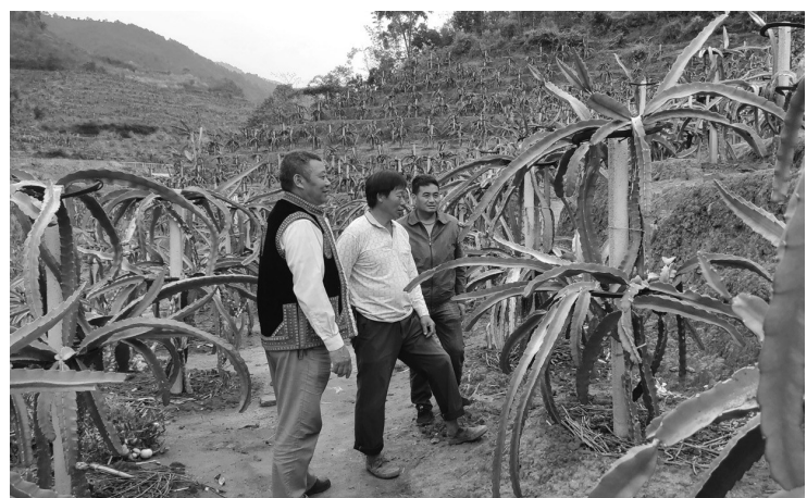
红河哈尼族彝族自治州烟草专卖局（公司）帮助挂钩帮扶的红河哈尼族彝族自治州石屏县哨冲镇多白者村发展火龙果种植产业。

察势者智，顺势者赢。智慧烟草农业和智慧财务建设仅仅是红河烟草数字化转型的起点。志存高远、追求卓越的红河烟草人有着更高的目标追求，正布下更