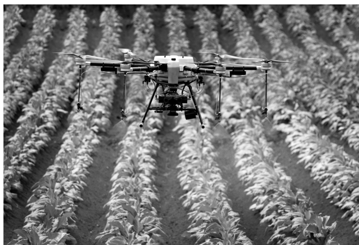
泸西县开展烤烟无人机统防飞防病虫害。