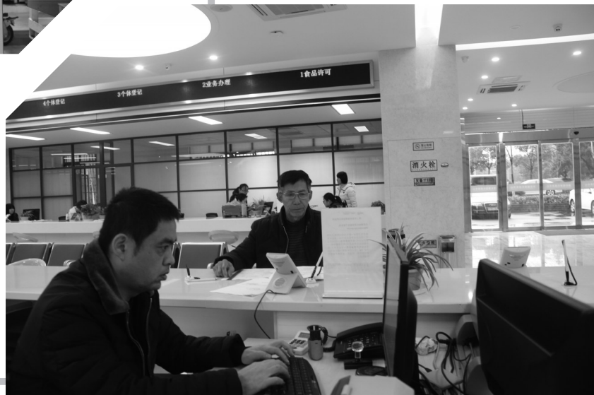
下图 洛社镇为民服务中心拥有工商、国地税、不动产登记、房产租赁、民政残联、城市管理30多个窗口，深入推进机关效能建设，有效服务洛社镇周边企业和群众。这是服务中心工作人员为群众办理业务。