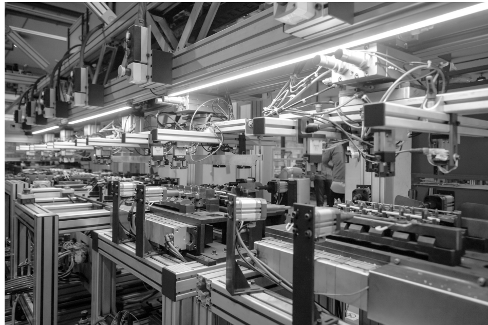
无锡华光汽车零部件集团有限公司车间内一派忙碌，一批订单产品正等待机器人检测。

联服务，及时跟进事中、事后服务监管，开展市场主体“一件事”调查研究。精心梳理253个行政审批、公共服务事项等，集成39个服务窗口实现一窗通办，新增24小时“随时办”自助服务区，各类市场主体和群众实现了就近就近办事办证，满意度大为提升。