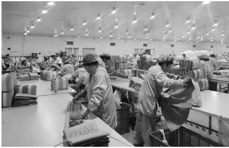
平顶山市德美工贸有限公司生产车间